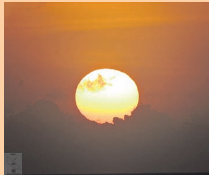
Imagen asombroso di prome salida di solo pa aña 2020

ORANJESTAD – Dia 1 di januari 2020 pa 7:09 di mainta a sali e prome solo di aña nobo 2020 di e decada nobo 20 di siglo 21 y di e tercer milenio.